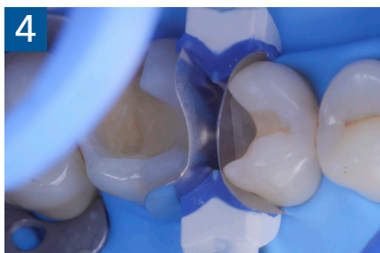
Fig. 4 Aspetto della chiusura cervicale e sulle pareti assiali dato dalla prima matrice