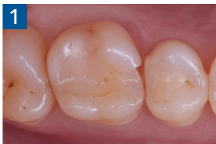
Fig. 1 Fotografia iniziale

sposando l'anello che viene immediatamente rialloggiato. A questo punto, eliminato lo spessore dato dalla seconda matrice, si procede con la creazione della seconda parete. Trasformate la cavità da II classi a I classi si procede con la classica modellazione cuspidale per cuspidale sfruttando le caratteristiche meccaniche e perchè no, anche estetiche, dei materiali compositi bulk.