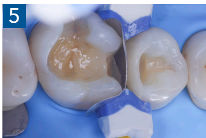
Fig. 5 Aspetto della chiusura cervicale e sulle pareti assiali della seconda matrice