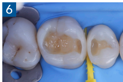
Fig. 6 Aspetto oclusale delle pareti interprossimali appena create