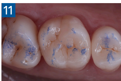
Fig. 11 Restauri ultimati sotto controllo oclusale