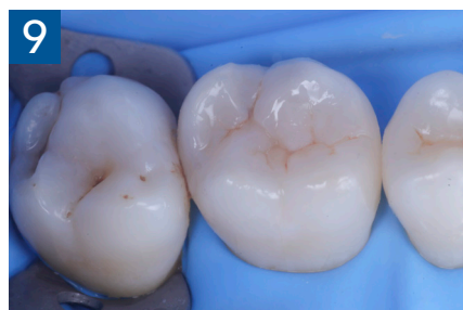
Fig. 9 Modellazione ed aspetto vestibolare