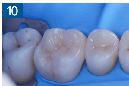
Fig. 10 Modellazione ed aspetto palatino