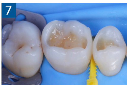
Fig. 7 Aspetto vestibolare delle pareti interprossimali appena create