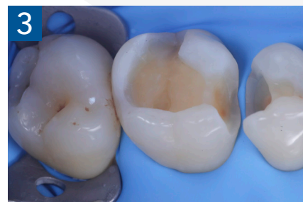
Fig. 3 Aspetto vestibolare della cavità ultimate