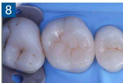
Fig. 8 Modellazione ed aspetto oclusale