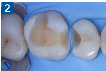
Fig. 2 Isolamento e aspetto delle cavità ultimate