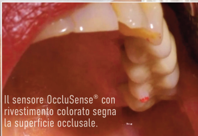
Il sensore OccluSense® con rivestimento colorato segna la superficie oclusale.

Utilizzare OccluSense® come tester per occlusione tradizionale. I rapporti di pressione occlusione statici e dinamici vengono registrati e memorizzati nell'app per iPad OccluSense®.