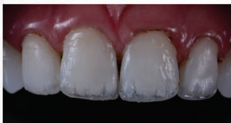
Veneer diretti con Opallis prodotti sui denti da 12 a 22 utilizzando opacità differenti per ricreare i diversi tessuti.