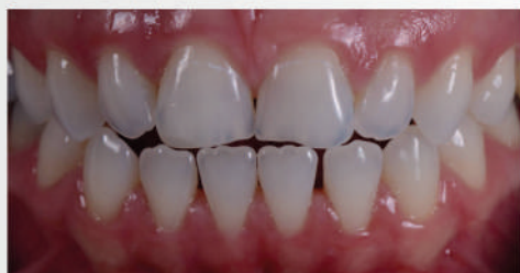
Aspetto iniziale: dente superiore anteriore che necessita di anatomizzazione.