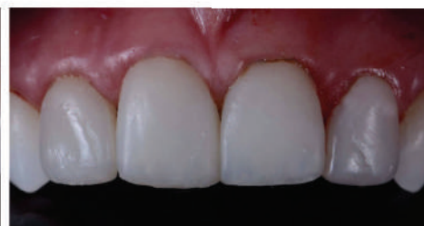
Restauri conclusi prima della lucidatura.

Al termine della finitura e lucidatura, il sorriso mostra armonizzazione di allineamento e forma del dente.