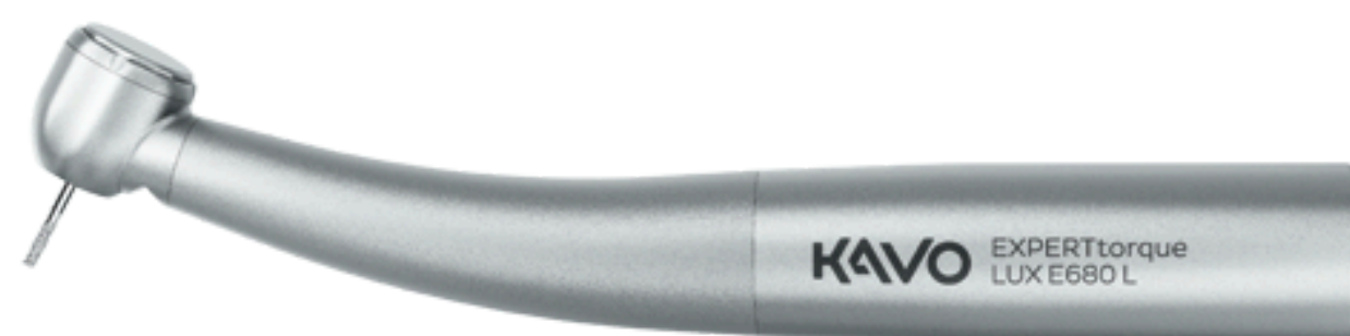
EXPERTtorque E680 L turbina ora a 620€