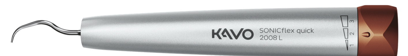
SONICflex quick Set 2008 L scaler sonico ora a 1.227€